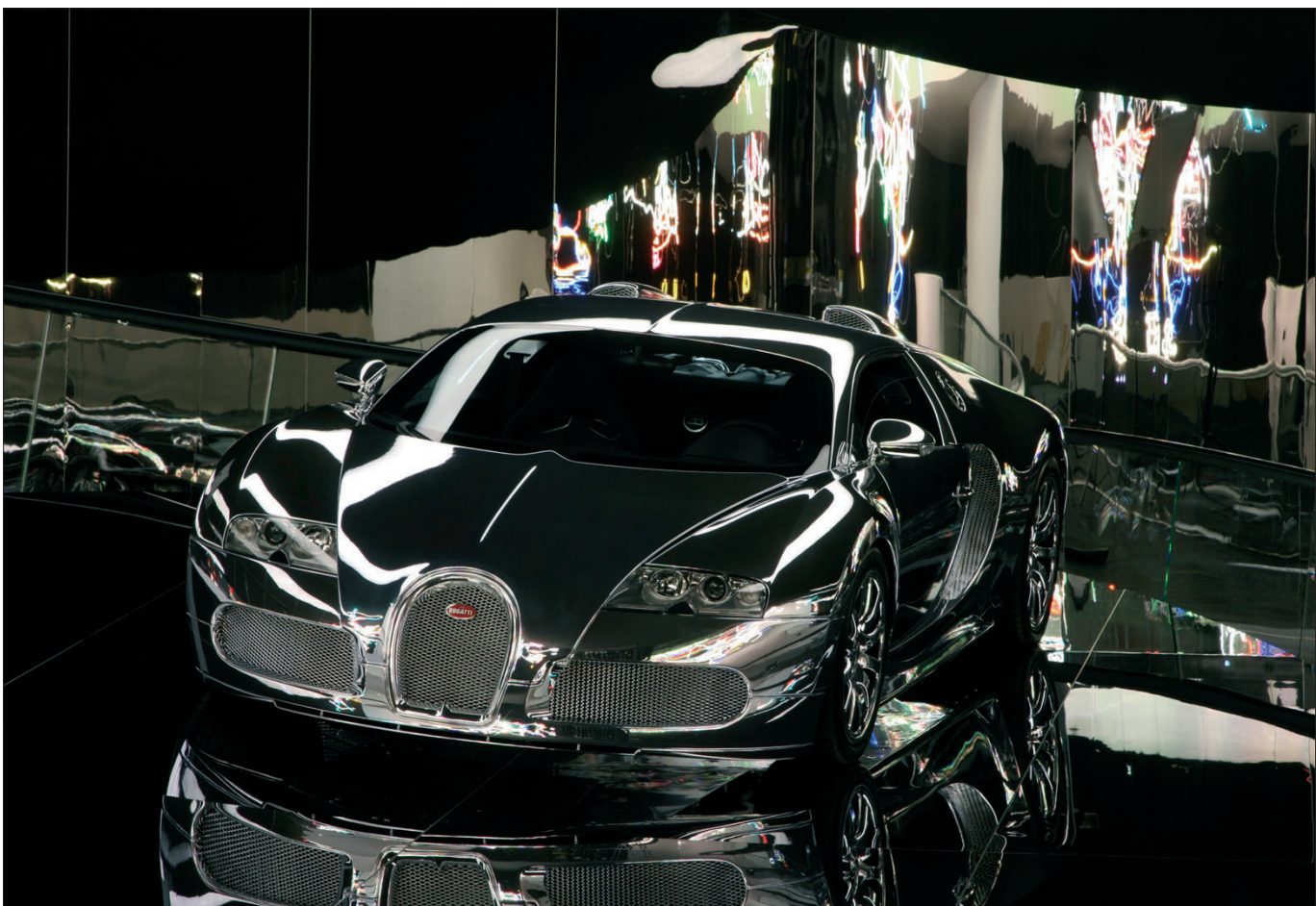
Dieser Bugatti Veyron 16.4 ist das jüngste Kunstwerk für die Autostadt des VW-Konzerns in Wolfsburg. Das rund 2,4 Millionen Euro teure Einzelstück wurde von der Lackiererei Blach in Ansbach verspiegelt.

Schon seit zehn Jahren hat der Ansbacher Betrieb mit der Verspiegelung von verschiedenen Materialien experimentiert und unter anderem glänzende Helme für den internationalen Ski-Zirkus entwickelt ( die FLZ berichtete ). Der Ruf reicht inzwischen weit. „Die Lackiererei Blach wurde wegen ihrer herausragenden Kompetenz ausgewählt“, erklärt ein Sprecher